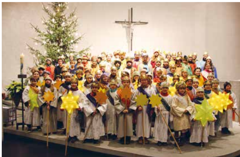
Aufgestellte und motivierte Sternsinger-Kinder

Mit Stolz blicken wir auf 20 Jahre ökumenisches Sternsingen in Eschlikon-Wallenwil zurück. Der grosse Dank für