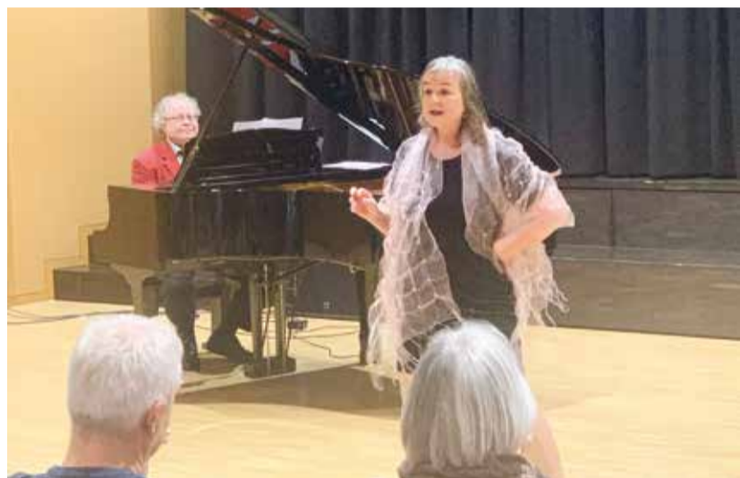
Ein überaus gelungener Abend läutete die Kultursaison 2024 in Eschlikon ein.