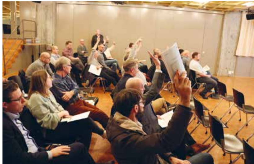
Knapp – mit acht zu neun Stimmen – sagten die Delegierten Nein zur zweiten Tarifierhöhungstranche, welche der RVM-Süd-Verwaltungsrat beantragt hatte.

Umstritten war aber die zweite Tranche von weiteren vier Rappen. Diese hatte der RVM-Süd-Verwaltungsrat den Gemeinden erst später beantragt. Widmer verwies darauf, dass die zweite Erhöhung, die auf den 1. Oktober 2024 hin in Kraft hätten treten sollen, notwendig sei, weil die realen Strompreise für Jahr 2024 erst nach der Beantragung der ersten