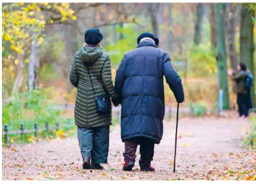
Eine Abstimmung, die polarisiert – Initiative für ein 13. AHV-Rente und Renteninitiative.

Am Anfang der Überlegungen zu diesem Thema steht eine unbestreitbare Tatsache: Die heutigen AHV-Renten sind zu tief und reichen nicht mehr, den Existenzbedarf zu decken. Oder könnten Sie mit rund 1800 Franken monatlich anständig leben? Obwohl die AHV der Teuerung angepasst wird, sind zum Beispiel die steigenden Krankenkassenprämien nicht berücksichtigt. Natürlich kann man nach der Pensionierung Ergänzungsleistungen beziehen. Aus verschiedenen Gründen darf das aber nicht die Lösung sein. Erstens schreibt unsere Verfassung vor, dass die AHV existenzsichernd sein muss. Zweitens soll es nicht sein, dass man kaum pensioniert, EL beantragen muss. Jede Frau und jeder Mann, der hier sein Leben lang gearbeitet hat, soll