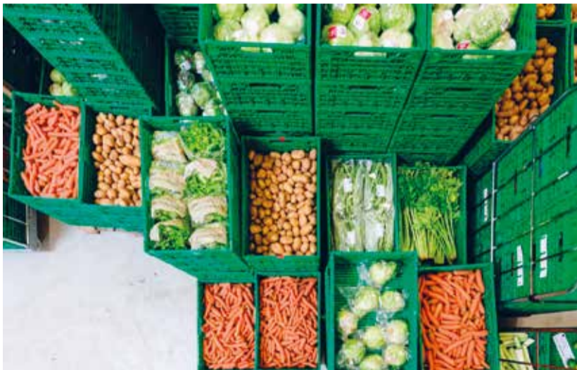
Entlastet schmale Budgets und vermindert «Food Waste» – Tischlein deck dich.

Münchwilen – In der Schweiz leben gemäss Bundesamt für Statistik rund 745 000 Menschen an oder gar unter der Armutsgrenze. Gleichzeitig wird auf dem Weg vom Feld bis zum Teller jedes dritte Lebensmittel weggeworfen – das entspricht 2,8 Millionen Tonnen vermeidbaren Lebensmittelabfällen pro Jahr. Mit der Vision diesen Missständen entgegenzuwirken, engagieren sich über 4200 Freiwillige an schweizweit 158 Tischlein-deck-dich-Abgabestellen. Der Verein Tischlein deck dich ist schon seit 25 Jahren in der Lebensmittelrettung und Lebensmittelhilfe tätig – 20 Jahre davon auch in Münchwilen.