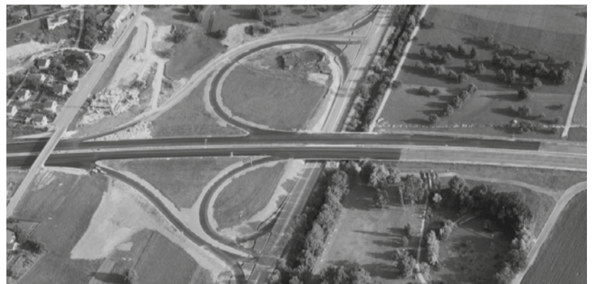
Die Nationalstrasse N1 (heute Autobahn A1) während der Bauphase im Juli 1969.