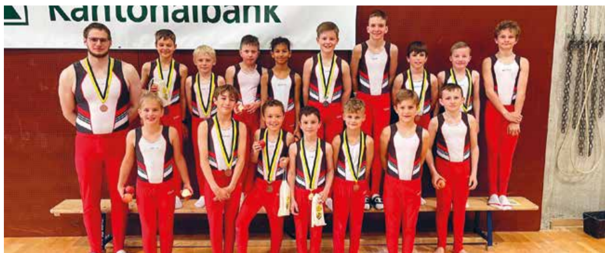
Die Turner der Kategorien 2 bis 4 und 7 nach der Rangverkündigung.