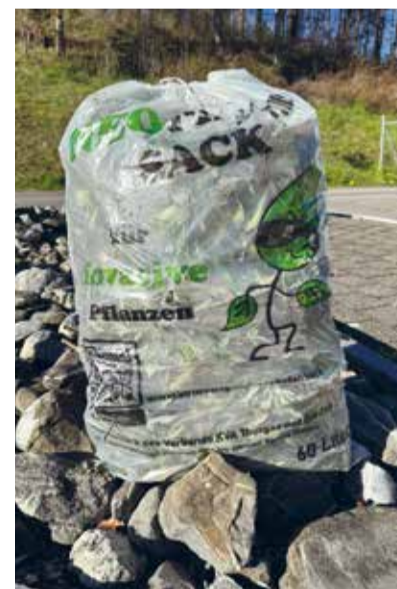
Der neue und kostenlose Neophytensack.

Ein Flyer sowie die Website des Amtes für Umwelt des Kantons Thurgau ( www.umwelt.tg.ch/neophytensack ) listen auf, wie mit welchen Problempflanzen zu verfahren ist. Alle Fragen rund um den Neophytensack richten Sie bitte an die Fachstelle Biosicherheit des Kantons Thurgau (Telefon 058 345 51 51).