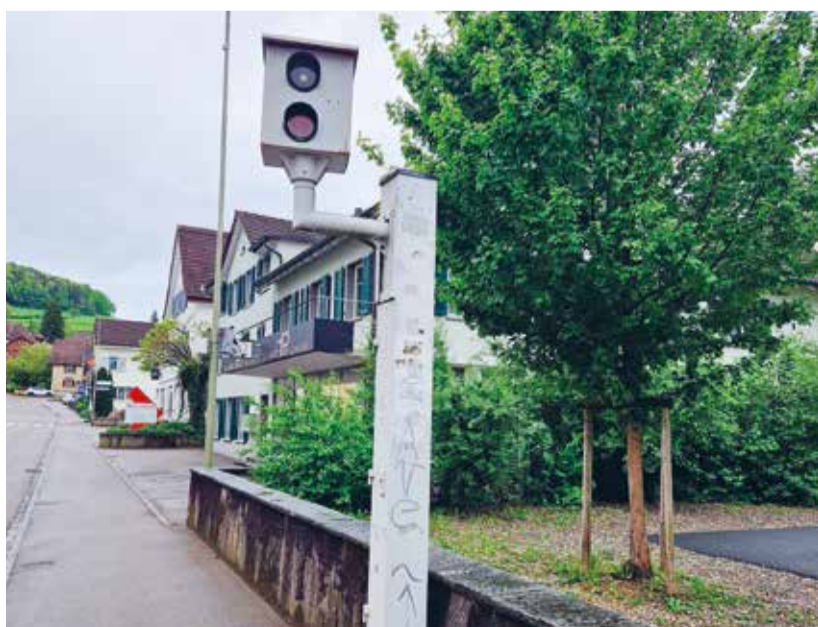
Der Blitzer an der Winterthurerstrasse ist wieder voll im Einsatz. Die Geschwindigkeitsanzeige einige Meter davor kommt den Autofahrern gerade zugute.

Auslöser für die Nachfrage bei der Polizei war ein Eintrag in der