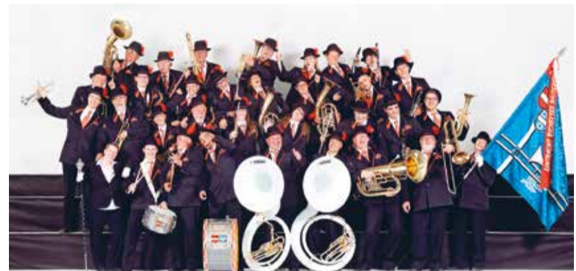
... und die Musikgesellschaft Eintracht laden zum Konzert.