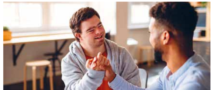
Erfahren Sie an den Aktionstagen mehr über das Leben mit Behinderung.