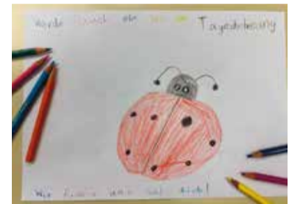
Spiel und Spass.

woche, in den Sportferien sowie in der ersten Frühlingsferienwoche statt. Die Ferienzeit wird genutzt für Projekte sowie tolle Ausflüge, denn während der regulären Schulzeit sind Ausflüge fast unmöglich. In den Frühlingsferien fanden Besuche im Zoo, im Naturmuseum Winterthur sowie am Kidsfliz statt.