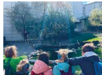
Ausflug in die Natur.

Während fünf Wochen im Jahr bietet die feB auch in den Schulferien eine Ferienbetreuung von 7 bis 18 Uhr an. Diese findet in den ersten beiden Sommerferienwochen, in der ersten Herbstferien-