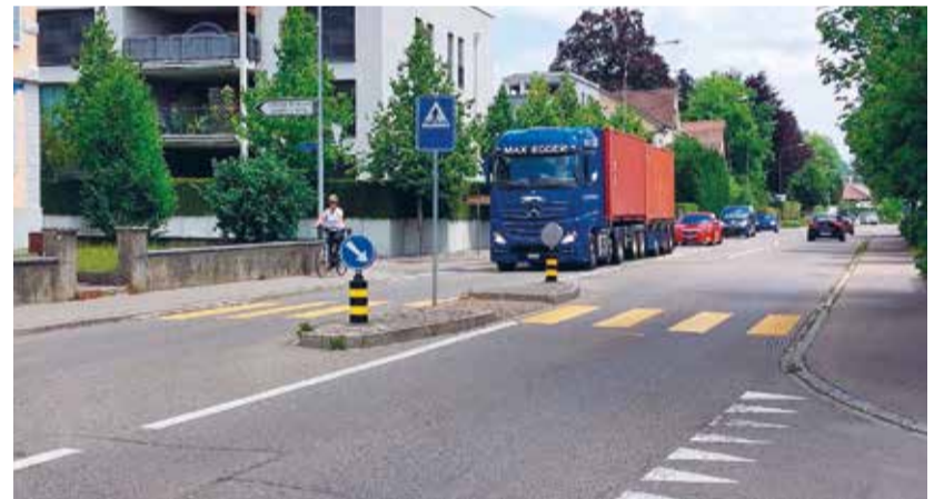
Die Ortsdurchfahrt soll saniert und aufgewertet werden.

Informationsveranstaltung Sanierung/Aufwertung Ortsdurchfahrt: Dienstag, 11. Juni 2024, 19.00 Uhr Mehrzwecksaal Bächelacker (es wird rechtzeitig ein Flugblatt in alle Haushaltungen der Gemeinde verteilt)