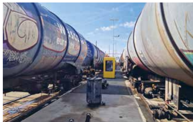
Die Lastwagenfahrer befüllen ihre Fahrzeuge eigenhändig.