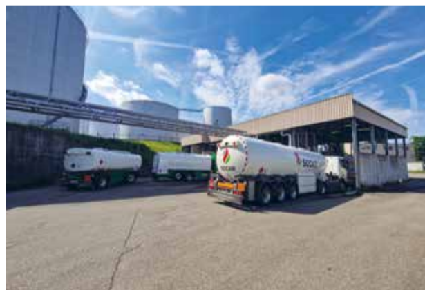
An der Camionfüllstelle kommen pro Tag mehrere Lastwagen vorbei.