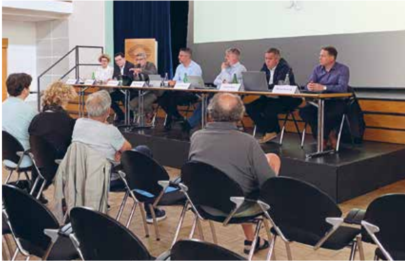
Der Gemeinderat Aadorf informierte über die Legislaturziele bis 2027.

Das erste Strategieziel fokussiert sich auf Aadorf als Zentrum und dessen Aufwertung. Dabei möchte man die Aufenthaltsqualität erhöhen und das Zentrum räumlich entwickeln. Aufgrund des hohen Zuwachses sei auch