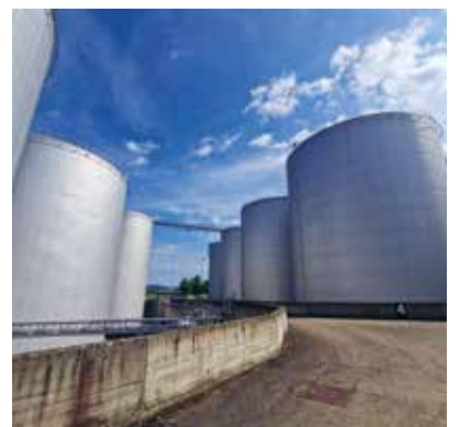
Eines der grössten Tanklager der Schweiz.