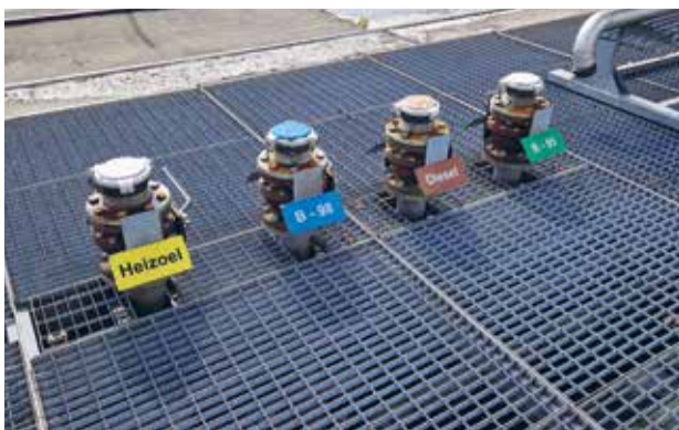
Heizöl, Bleifrei 98, Diesel und Bleifrei 95 lagern in Tobel-Tägerschen.