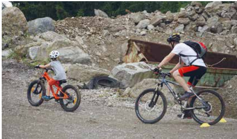
Komm vorbei und bike mit uns in der Kiesgrube Tobel.