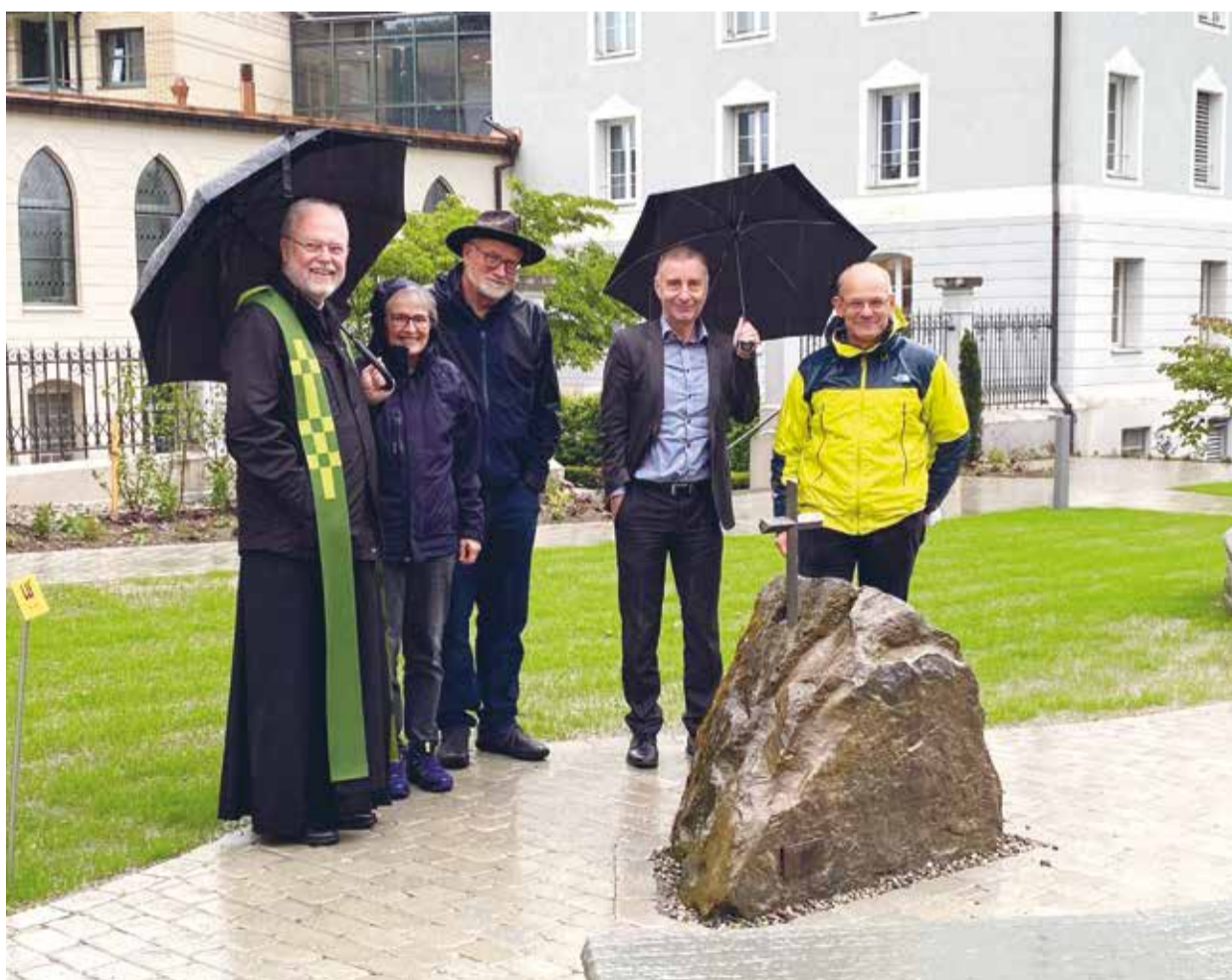
Ein zusätzlicher Ort der Besinnung mit Sitzgelegenheit als Geschenk der Bauunternehmer.

Hinter dem Kräutergarten steht eine tiefe Symbolik. Die Hauptachse führt vom Eingang beim Rosenbogen auf der linken Seite bis zum Marienstein auf der rechten Seite. Gekreuzt wird die Achse in der Mitte durch einen Bachlauf und stellt so die Symbolik des Kreuzes dar. Der Bachlauf selber weist uns auf das Wasser des Lebens hin: Im Schöpfungsbericht verwandelt Gott eine trostlose Wüste in einen Garten, durch den ein Fluss fliesst, der den Erdboden wässert und Leben überall dort hinbringt, wo er entlang fliesst. Die Holzbrücke, welche über den Bachlauf führt, weist den Besucher auf die Verbundenheit untereinander hin und symbolisiert zudem das Dies- und das Jenseits.