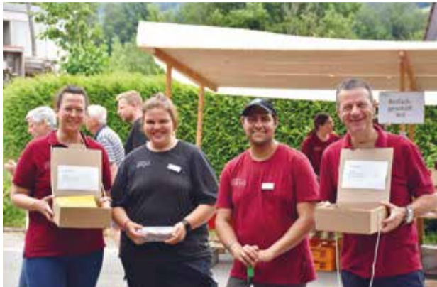
Gross war das Angebot am Tag der offenen Tür.

Vogelsang – Im Juni fand im KORN.HAUS in Vogelsang ein Tag der offenen Tür statt. Das Wetter war diesem Anlass zum Glück mehr oder weniger gut gesinnt. Ausser ein paar Regenspritzern zwischendurch schien die Sonne und man konnte so richtig schön die verschiedenen Betriebe des KORN.HAUS besichtigen, den Marktstand des Biofachgeschäfts unter die Lupe nehmen sowie feines Müesli und frischen Zopf mit leckerem Brotaufstrich degustieren. Die stündlichen Führungen mussten teils aufgeteilt werden, da so viele Leute das KORN.HAUS näher kennenlernen wollten. In der Schreinerei wurden tolle Vogelhäuschen und Bienenhotels unter fachkundiger Anleitung gefertigt, die Kinder konnten Malen und Basteln und sich schminken lassen – herrlich in die glänzenden