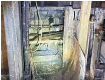
Der Brand brach in einem Elektrokasten aus.