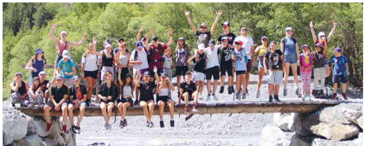
Im vergangenen Jahr hatten die Kinder viel Spass im zweiwöchigen Lager.

Das aufgestellte junge Leitungsteam setzt sich aus zehn motivierten Personen zusammen, die alle bereits als Kinder das Lagerleben in verschiedenen Destinationen geniessen durften und danach jahrelange Erfahrung als Helfer oder Leiter gesammelt haben. Auch die dreiköpfige Kochmannschaft hat die Bewährungsprobe mit einem abwechslungsreichen Menüplan bestens bestanden. Viele Stunden wurden von allen Beteiligten seit anfangs Jahr mit grosser Freude in die Vorbereitungen gesteckt. Und dann das Aus, welch ein Frust! Heuer wäre das Lagerhaus «Heidi» in Unteriberg in Kanton Schwyz das Reiseziel gewesen.