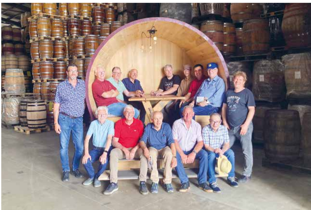
Der Männerchor Ettenhausen im Lager der Käferei Eder.