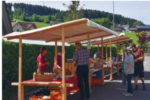
Gut besuchte Stände im Freien dank Wetterglück.

Kinderaugen zu schauen. Frisch gebackene Guetzli wurden verziert, verpackt und etikettiert. Eine reichhaltige Tombola konnte dank unseren Geschäftspartnern zusammengestellt werden. In der Nudelwerkstatt wurden frische Tortellini degustiert