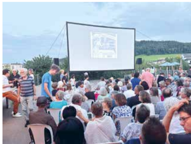
Das schöne Sommerwetter steuerte viel zum Gross-Erfolg bei.