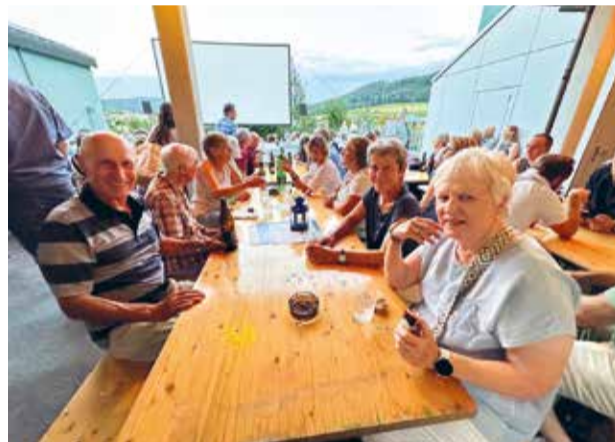
In der Festwirtschaft liessen sich die Gäste im Voraus kulinarisch verwöhnen.

in seiner Rolle als emsiger Bundesbeamter, dem die schwierige Aufgabe zugesprochen war, eine neue Landessprache in der Schweiz durchzusetzen. Eine verrückte Volksabstimmung über die neue Einsprachigkeit wirft Helvetien in einen absoluten Ausnahmezustand. Mittendrin der unerschrockene