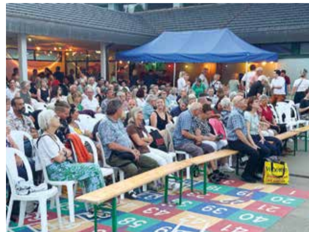
Das Interesse am traditionellen Open-Air-Kino in Ettenhausen war riesig.