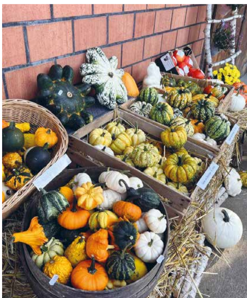
Am 28. September sind auf dem Iltishof unzählige Kürbisse in allen Farben und Formen zu bestaunen.

Wer sich für die Vielfalt der hierzulande sehr bekannten Gemüsesorte interessiert, der kommt am Samstag, 28. September auf dem Iltishof bei Familie Weber voll auf seine Kosten. All die prächtigen Kürbisexemplare aus dem aktuellen Jahr werden liebevoll dekoriert zur Schau gestellt. Selbstverständlich können die Speise- und Zierexemplare auch gekauft werden. Frisch, regional und nachhaltig produziert überzeugen die Kürbisse in ihren bunten Farben und Formen. Die Festwirtschaft versorgt die hoffentlich zahlreich erscheinenden Gäste mit feinen Speisen und erfrischenden Getränken. Nebst den Klassikern wie Pommes Frites, Hamburger und Würste gibt es selbstverständlich auch die «Spezialität des Hauses», in Form einer frisch zubereiteten Kürbissuppe. Für die musikalische Unterhaltung sorgt ab 11.00 Uhr die Jagdhornbläser Gruppe «Waldkauz» aus der Nachbargemeinde Elgg. Zwischen 13.30 und 17 Uhr findet der Hofmarkt mit