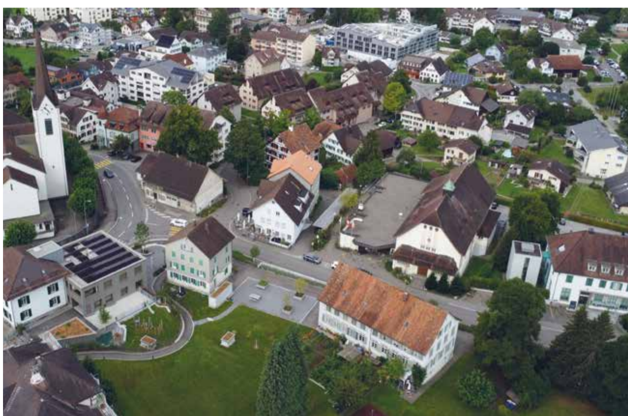
Das Gemeindezentrum Dreitanen (rechts) und das Haus zur Brückenwaage stehen im Mittelpunkt der geplanten Dorfkerngestaltung in Sirmach.

Sirmach – Am Mittwochabend fand im Gemeindezentrum Dreitanen in Sirmach eine gut besuchte Partizipations- und Informationsveranstaltung zur Gestaltung des Dorfkerns statt. Unter dem Motto «Gemeinsam bringen wir Sirmach voran» kamen rund 80 Bürgerinnen und Bürger zusammen, um über die geplante Sanierung und Weiterentwicklung des Gemeindezentrums Dreitanen und der Brückenwaage zu diskutieren. Die Veranstaltung stand im Zeichen einer möglichst