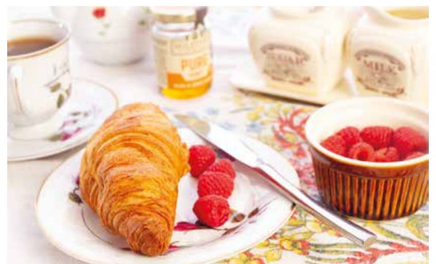
Am Samstag, den 21. September, lädt die Evangelische Kirchgemeinde Münchwilen-Eschlikon alle Frauen herzlich zum «Frauezmorge» ein.

Anmeldung bis am 16. September an Dominique Stahl, dominique.stahl@evang-muenchwilen-eschlikon.ch, Telefon 079 864 61 42. Ein Kinderhütendienst wird angeboten. Bitte zu betreuende Kinder auch anmelden.