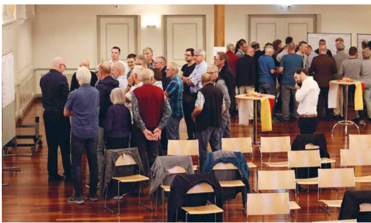
Bürgerinnen und Bürger von Sirmach beteiligen sich aktiv an den Diskussionsposten und bringen ihre Ideen zur Neugestaltung des Dorfkerns ein.

Ein Höhepunkt des Abends waren die drei vorbereiteten Diskussionsposten, an denen die Besucherinnen und Besucher die Gelegenheit hatten, aktiv ihre Meinungen und Vorschläge einzubringen. Die Themen der Posten – «wegweisend», «einladend»