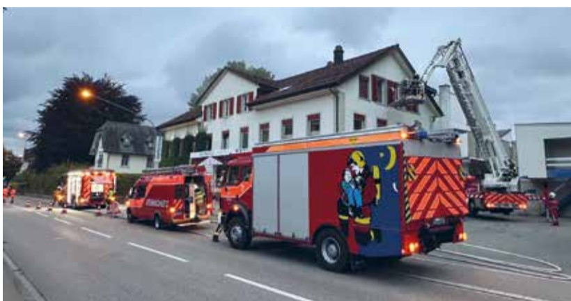
Die Feuerwehren von Eschlikon und Münchwilen haben den Ernstfall erfolgreich gemeinsam geübt.

positives Fazit: «Die Übung war erfolgreich und wir haben die Herausforderungen in kürzester Zeit zusammen mit der Stützpunktfeuerwehr Münchwilen gemeistert». Diese bestanden mitunter