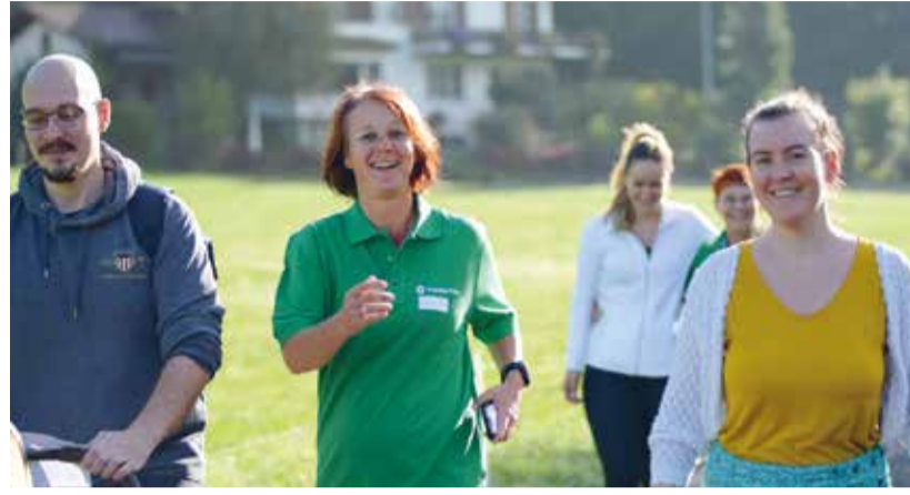
Teilnehmende des OnkoLAUFs in Bichelsee-Balterswil starten gemeinsam für den guten Zweck. Der Lauf verbindet Bewegung mit Solidarität und unterstützt Krebsbetroffene im Kanton Thurgau.

In den letzten beiden Jahren durften wir uns über jeweils rund 100 Teilnehmende vor Ort erfreuen. Wir waren von dieser Anzahl überwältigt und freuen uns natürlich auch über mehr Teilnehmer.