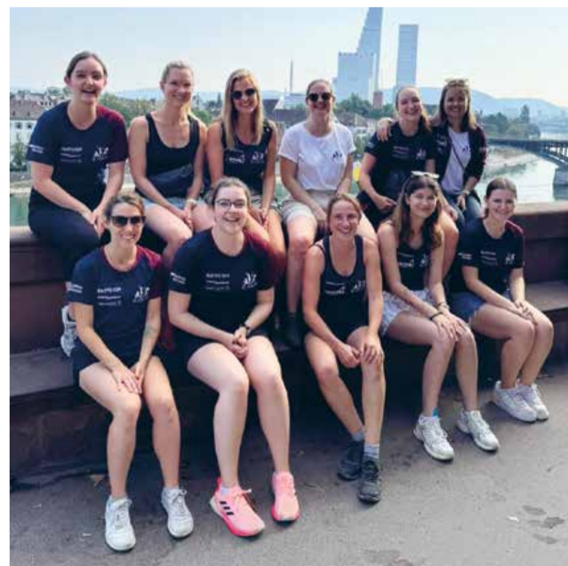
Die Turnfahrt der Damenriege Eschlikon nach Basel war ein grosser Spass.

Rein in die Badehosen und ab ins Vergnügen – auf dem Nachmittagsprogramm stand das Rheinschwimmen. Beim Tinguely-Museum ist der optimale Einstiegsort, um möglichst lange im Wasser zu sein. Nach zirka zwanzig Minuten und knapp drei Kilometer weiter unten stiegen die erfrischten Damen aus dem Gewässer und liessen den Samstag bei einem gemütlichen Essen mit Blick auf den Rhein ausklingen. Drei ganz Verrückte zogen bis in