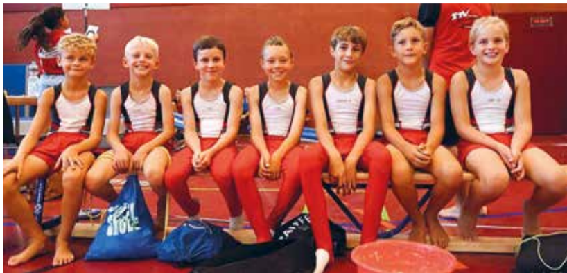
Die Eschliker Geräteturner der Kategorie 2 am Reck.