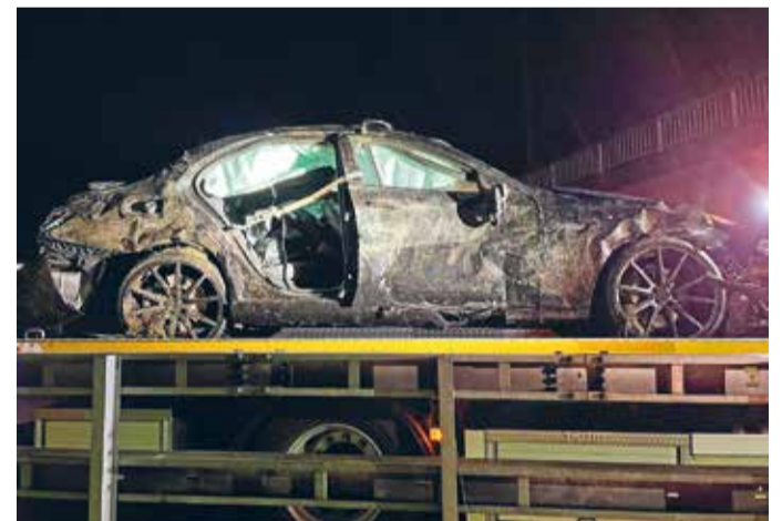
Da die Kantonspolizei Thurgau die Unfallbilder knapp nach Redaktionsschluss versendete, liefern wir diese nun noch nach.