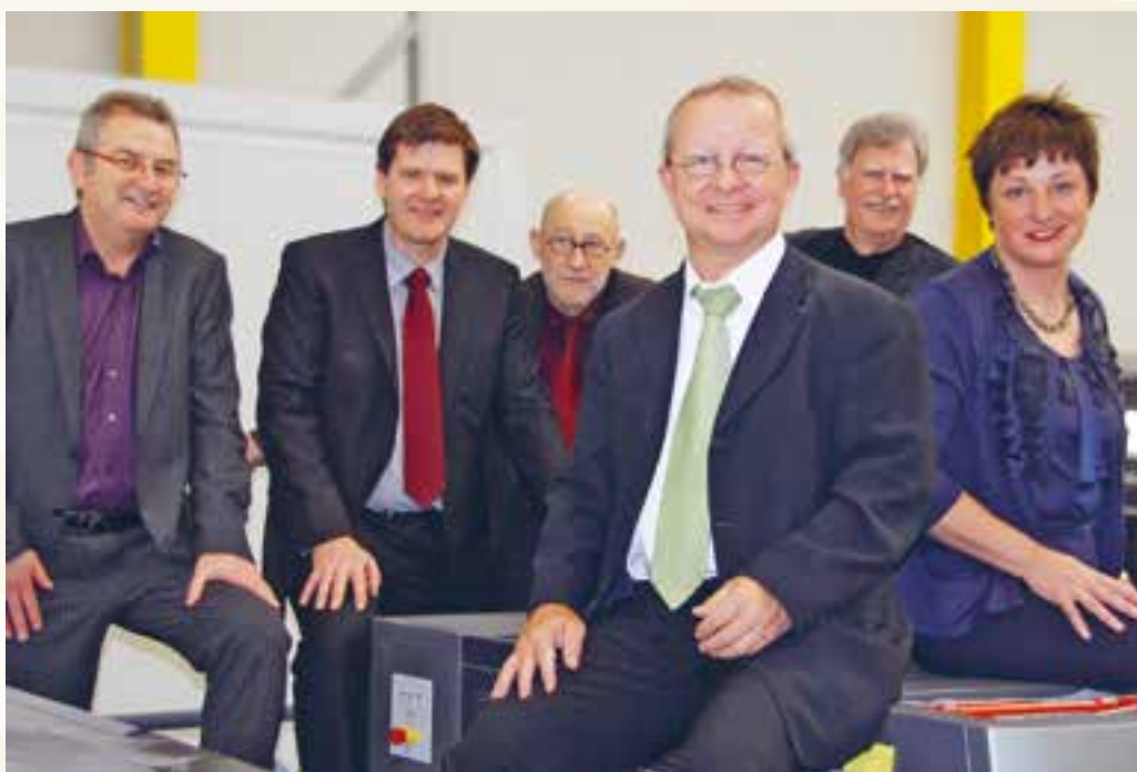
Der erste Verwaltungsrat im Jahr 2011 an der Feier der Erstausgabe.

Perfektes Konzept für den Hinterthurgau Aber wie so oft, kommt es anders als man denkt! Entgegen des landesweiten Trends, welchem viele Lokal- und Regionalzeitungen zum Opfer fielen, fanden sich anfangs 2010 im Hinterthurgau einige Unentwegte zusammen, um ein neues Zeitungsprojekt für den Bezirk Münchwilen voranzutreiben. Der Grund war, dass sich verschiedene Kreise von der übrig gebliebenen Presse zu wenig gut vertreten fühlten. Unzufriedenheit hatte